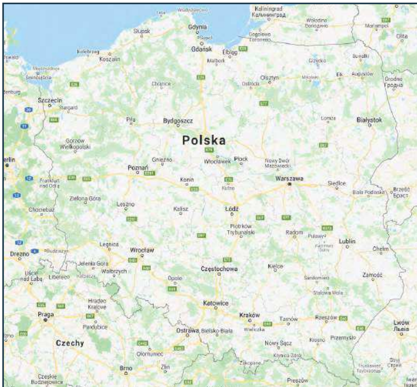
Orientacyjna mapa szkół prowadzących kształcenie w zawodzie ZDOBNIK CERAMIKI w roku szkolnym 2020/2021