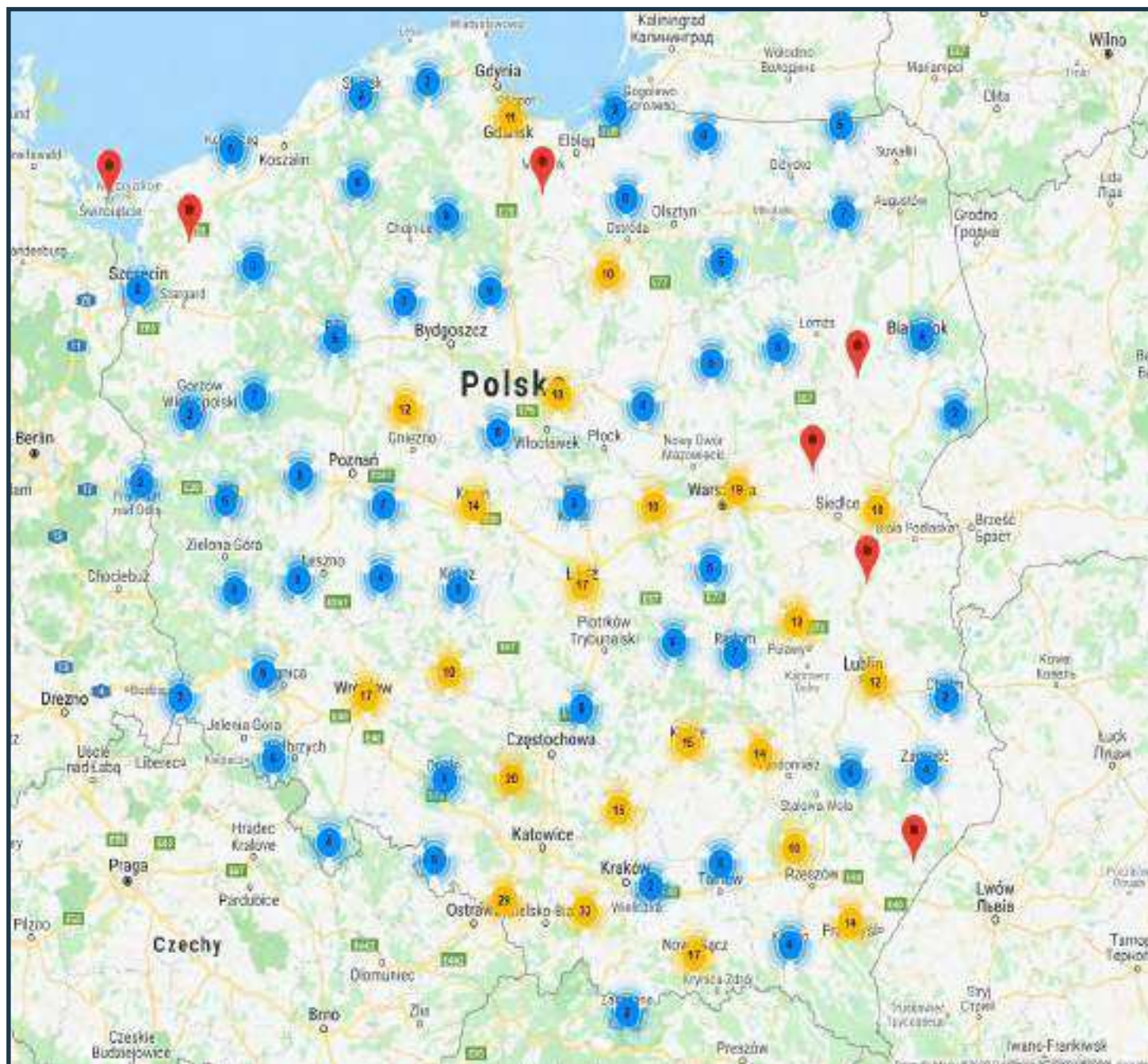
Orientacyjna mapa szkół prowadzących kształcenie w zawodzie TECHNIK EKONOMISTA w roku szkolnym 2020/2021